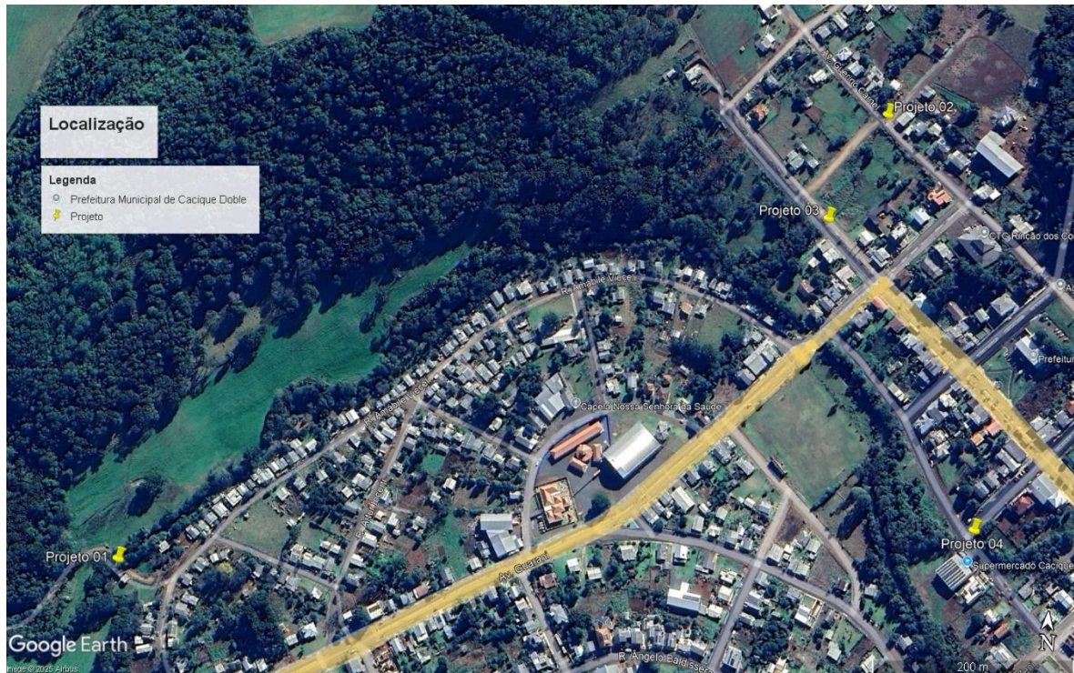
Imagem com marcação dos 4 projetos